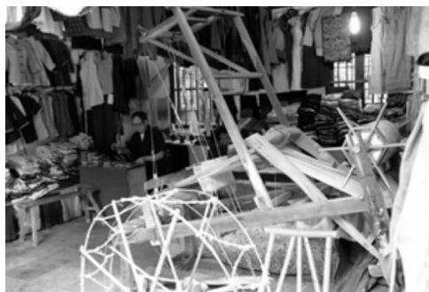
图2 周庄土布作坊内景

为使南通色织土布以其服用和饰用回归其本质,成为生活中的必需品,就要对南通色织土布的“实用性”进行挖掘。笔者以此为目的,做了一些尝试,如图3鼠标垫的设计和图4的包袋设计。鼠标垫是现代人们不可或缺的日常办公用品。图3中的鼠标垫造型简洁,表层是使用色织土布,边角处装饰激光镂空的仿皮材料,充分利用色织土布特有的质地增加鼠标使用时的摩擦力,底层使用仿皮材料,增加鼠标垫的厚度、柔韧性。图4的包袋设计简约大方,具有一定文艺气息。包袋主体材料采用蓝色防水帆布面料以及防水涂层处理的南通色织土布,以适合烟雨江南的生活环境。小面积处拼接三种不同明度的蓝色色织土布形成既和谐统一,又富有变化的色彩感,包袋手柄部位采用皮革材料,不仅结实耐磨,而且形成不同材质的对比。包袋除一般实用功能以外,还要与人的穿着打扮相协调,以彰显着装者的个性特点和审美品位。